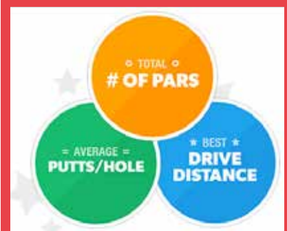
📷 Voorbeelden van challenges in Game Golf.

Dergelijke sociale functies komen ook steeds meer voor golf beschikbaar. Naast de wereldwijde best drive competition (product Arccos Driver) heeft Game Golf de mogelijkheid om challenges aan te maken, gebaseerd op één of een combinatie van statistieken zoals beste netto score, verste drive, meeste birdies of minste aantal putts per hole. Vervolgens kan voor de challenge een specifieke golfbaan worden gekozen of juist alle golfbanen in de wereld. Door, naast een besloten groep, de challenge open te stellen voor anderen, ontstaat een wereldwijd klassement.